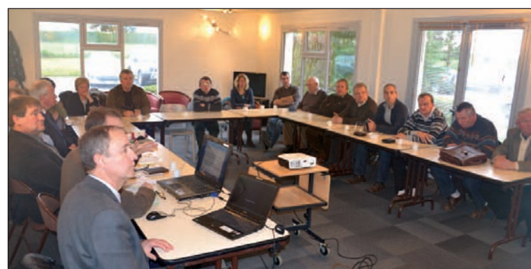
Une grande diversité de sujets a été abordée par les participants à l'assemblée de Péronne.