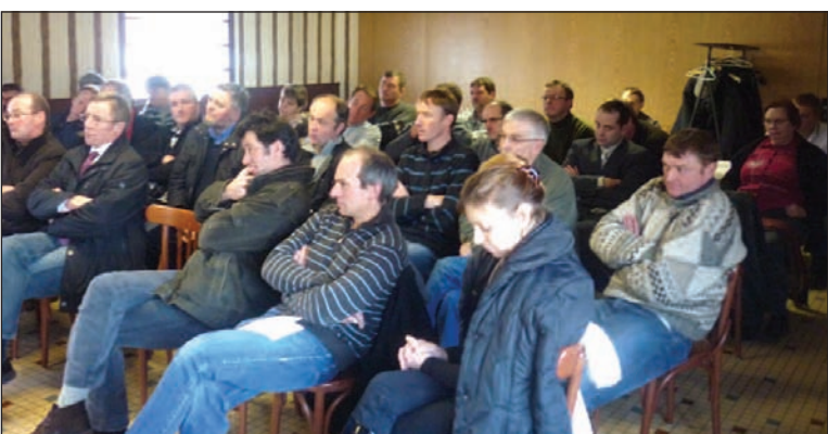
Une bonne participation à l'assemblée de Poix.