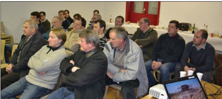
Les adhérents réunis à Berteaucourt-les-Dames pour l'assemblée cantonale.

SYNDICALISME Echos de l'assemblée de la commission dégâts de gibier de la Fdsea.