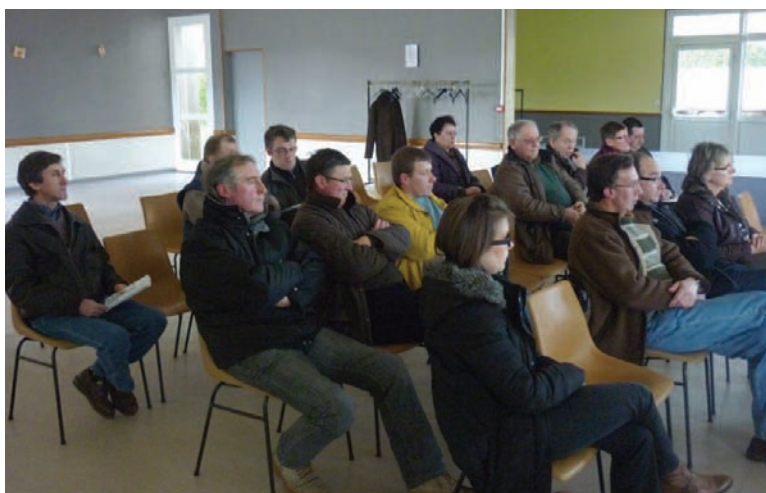
Les participants à l'assemblée.